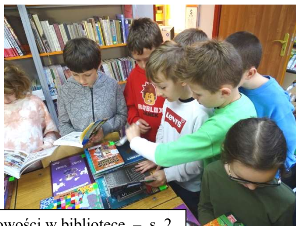
Nowości w bibliotece – s. 2