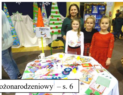
Kiermasz bożonarodzeniowy – s. 6