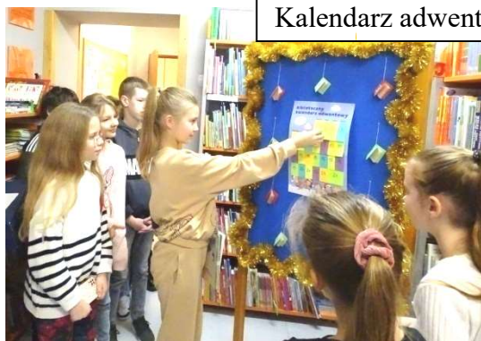
Kalendarz adwentowy – s. 6